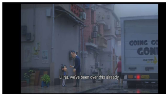
Gambar 3 menit 05.58

Merupakan sifat dimana anak harus mematuhi apa yang orang tuanya perintahkan Dan jangan pernah membantah terhadap perintah orang tua.