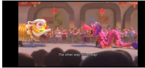
Gambar 8 menit 58.15

Dalam adegan tersebut Lina membantu Din melarikan diri dari orang yang ingin mengambil teko ajaib nya Din.