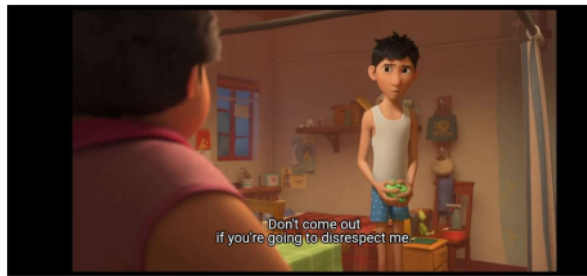
Gambar 5 menit 52.00

Pada adegan ini lina bersikap sopan terhadap ayahnya meskipun ayahnya tidak datang ke pesta ulang tahunnya dan menghargai pemberian ayahnya berupa kalung yang sama seperti ulang tahunnya yang sebelumnya.