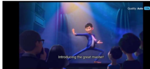
Gambar 7 menit 40.07

Merupakan sikap dimana seseorang membantu orang lain yang dalam kesusahan.