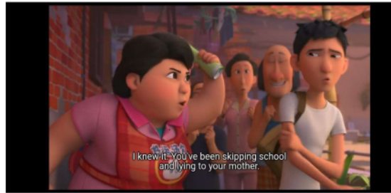
Gambar 1 menit 12.18