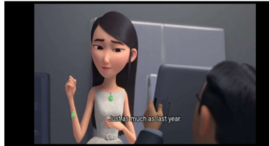
Gambar 4 menit 45.27

Merupakan rasa hormat yang muda terhadap yang tua dalam tutur kata atau perilaku.