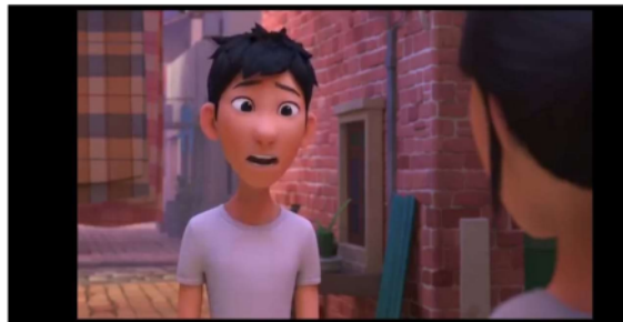
Gambar 2 menit 01.01.30

Dari scene tersebut menunjukkan bahwa din berbohong terhadap ibunya bahwa dia tidak masuk sekolah dan mengambil part time untuk bekerja. Dan yang scene satunya lagi menunjukkan bahwa din berbohong kepada lina bahwa dia adalah Dan bukan Din.