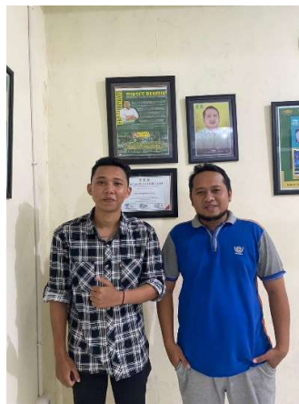
Gambar 2. Berfoto dengan Pemilik Usaha UMK F&B

Dari Penelitian yang dibahas yaitu Kapan bisnis UMK ini didirikan dan faktor apa yang membuat ibu/bapak tertarik dalam bisnis UMK ini?, Bagaimana data penjualan bisnis UMK ini dalam perbulannya?, Jenis produk apa saja yang ditawarkan dari bisnis UMK ini?, Apakah produk UMK ini sudah menerapkan sistem digitalisasi mengingat perkembangan zaman sudah merujuk prospek melalui digital?, Bagaimanakah saluran distribusi/pemasaran untuk memasarkan produk umkm ini ?, Berapa harga jual yang ditawarkan per produknya? Bagaimanakah strategi penetapan harga yang diterapkan untuk produk yang ditawarkan?