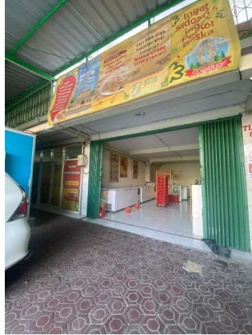
Gambar 3. Depan UMKM F&B

Juni 2023, tepat 3 tahun usaha pentol telah dipublikasikan bisnis pentol yang di buka melesat dengan cepat dan memiliki brand dengan atas nama bapak tersebut dan memiliki 1000 cabang di berbagai pulau Jawa dan juga Bali. Data penjualan bisnis UMKM memakai aplikasi sesuai dengan arus perkembangan manajemen yang telah tertata, dengan memakai data penjualan melalui aplikasi dapat memudahkan karyawan dalam mendata hasil penjualan dalam perbulan.