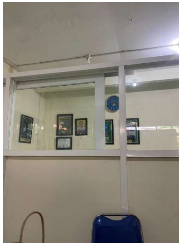
Gambar 4. Kantor UMKM F&B

Juni 2023, tepat 3 tahun usaha pentol telah dipublikasikan bisnis pentol yang di buka melesat dengan cepat dan memiliki brand dengan atas nama bapak tersebut dan memiliki 1000 cabang di berbagai pulau Jawa dan juga Bali. Data penjualan bisnis UMKM memakai aplikasi sesuai dengan arus perkembangan manajemen yang telah tertata, dengan memakai data penjualan melalui aplikasi dapat memudahkan karyawan dalam mendata hasil penjualan dalam perbulan.