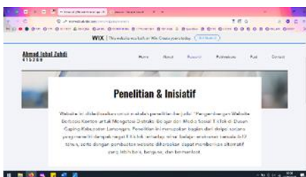
Gambar 5. Tampilan Research (ringkasan)