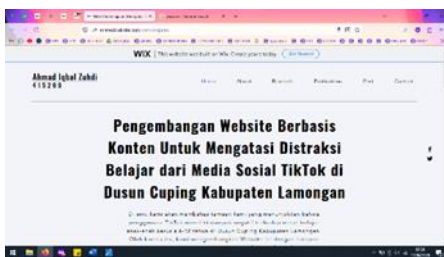
Gambar 3. Tampilan Home (halaman depan)

Adapun berikut tampilan website yang telah dikembangkan :