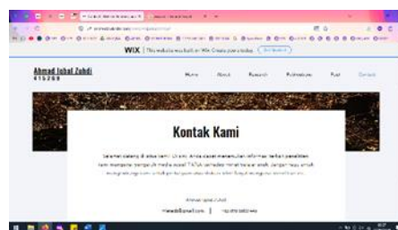
Gambar 8. Tampilan Contact (kontak peneliti)