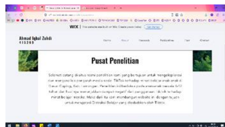
Gambar 4. Tampilan About (tentang motivasi peneliti)