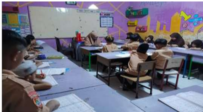
Gambar 2. Observasi kegiatan peserta didik dalam pembelajaran al-Qur'an menggunakan metode Wafa.

Proses pembelajaran juga memanfaatkan audio murottal untuk melatih kepekaan pendengaran peserta didik terhadap irama dan ketepatan bacaan. Peserta didik diminta mendengarkan, menirukan, dan mempraktikkan bacaan dengan bimbingan guru. Penggunaan audio ini membantu peserta didik menyesuaikan pelafalan dengan contoh bacaan yang benar. Selain itu, guru menggunakan gerakan kinestetik agar peserta didik dapat mengaitkan bunyi huruf dengan aktivitas tubuh. Kombinasi antara pendengaran, penglihatan, dan gerakan membuat proses belajar lebih konkret dan sesuai dengan karakteristik anak kelas awal.