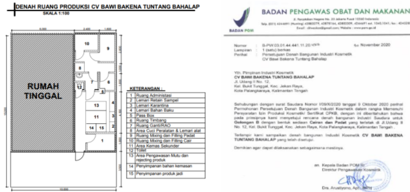
Gambar 2. Denah Industri CV Bawi Bakena yang telah mendapatkan persetujuan BPOM

perusahaan, aset perusahaan, SDM perusahaan, Jenis sediaan yang akan di produksi, NIB perusahaan, NPWP perusahaan, OSS ijin Produksi, OSS CPKB, OSS ijin Edar, dan surat permohonan izin persetujuan denah, dengan melampirkan denah bangunan yang telah di buat dengan skala 1:100. Sesuai dengan SOP, pengajuan denah membutuhkan waktu 7 (tujuh) hari kerja. Dalam memperoleh izin denah UMKM, tim melakukan 4 (empat) kali revisi hingga akhirnya pada tanggal 5 Desember 2020 BPOM RI menyetujui denah yang diusulkan.