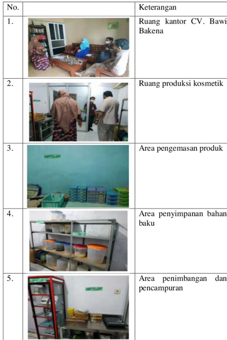
Tabel 1. Sarana, Prasarana, dan Produk CV. Bawi Bakena

herbal yang menonjolkan sisi tradisional dengan bahan alami dan menggunakan bahan tambahan yang terbatas tanpa pengawet sintetis (BPOM, 2021).