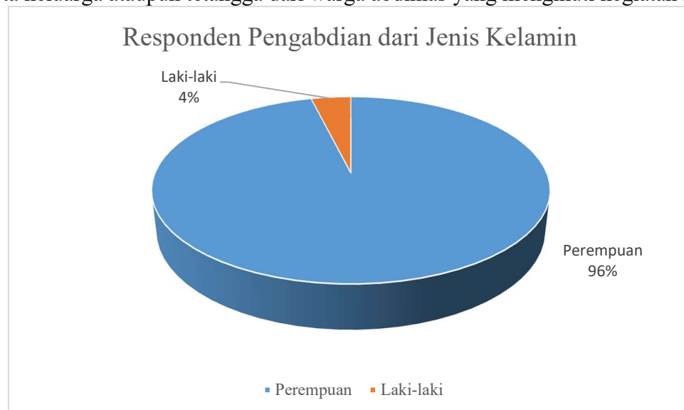
Gambar 3. Hasil kuisisioner responden berdasarkan jenis kelamin

Gambar 2 menyajikan data hasil kuisisioner responden yang didasarkan pada tingkat usia dari warga abdimas yang mengikuti kegiatan abdimas ini. Warga yang mengikuti kegiatan abdimas ini didominasi oleh masyarakat dengan rentang usia 41-50 tahun sebanyak 34% dari populasi. Kemudian masing-masing sebanyak 27 %, dan 23% diduduki oleh masyarakat dengan rentang usia berturut-turut 51-60 tahun dan 31-40 tahun. Keragaman variasi rentang usia ini disimpulkan bahwa peserta abdimas dalam lingkungan RT ini merata untuk semua kalangan. Sehingga, harapan dari kegiatan abdimas ini dapat menjangkau seluruh lapisan usia masyarakat dan dapat disebarluaskan kepada anggota keluarga ataupun tetangga dari warga abdimas yang mengikuti kegiatan ini.