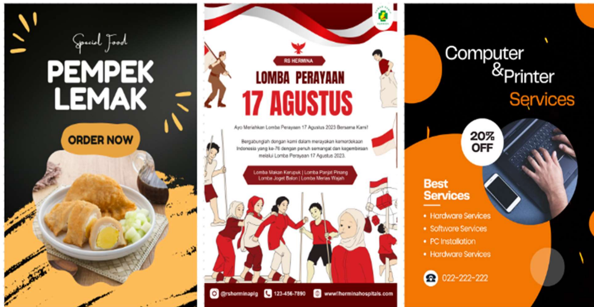
Gambar 2. Hasil Pengerjaan

dalam desain-desain yang dihasilkan. Pengguna merasa lebih percaya diri dalam merancang konten visual yang menarik dan profesional. Proses panduan telah mengarah pada peningkatan keterampilan desain mereka, serta hasil desain yang lebih efektif dalam kampanye promosi dan komunikasi mereka. Dengan menggunakan Canva, pengguna dapat mencapai tujuan promosi dengan lebih baik, meningkatkan interaksi konsumen, dan secara keseluruhan, memperkuat merek dan pertumbuhan ekonomi lokal. Berikut ini ada beberapa hasil desain yang dikerjakan oleh peserta workshop .