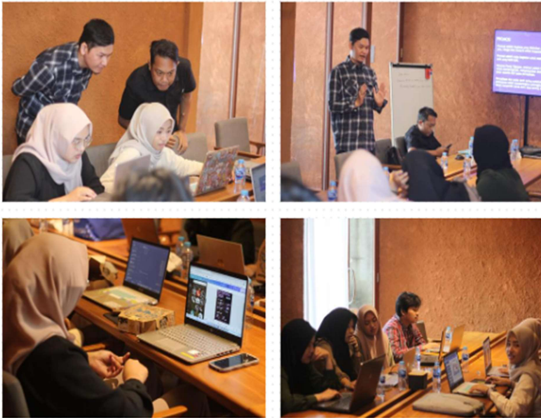
Gambar 3. Proses Diskusi Pada Workshop