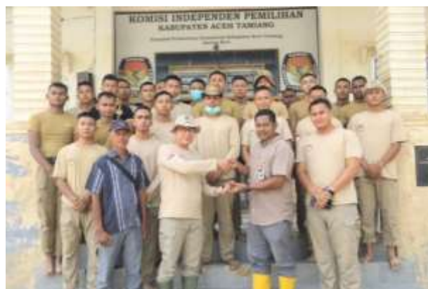
Gambar 4. Pembagian Peran dalam Pelaksanaan Tugas Kemanusiaan.