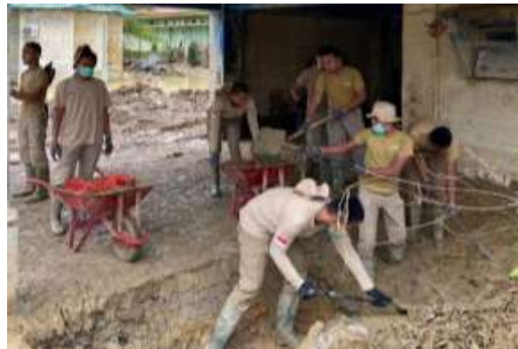
Gambar 2. Kondisi Awal Aceh Tamiang Pasca Banjir.