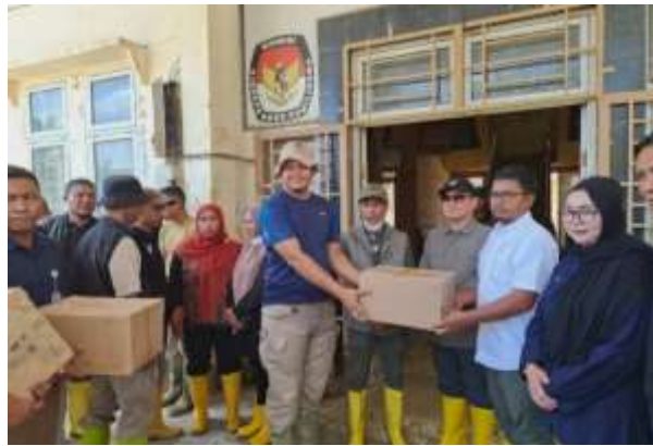
Gambar 3. Facilitative Leadership dalam Pelaksanaan Tugas Kemanusiaan.