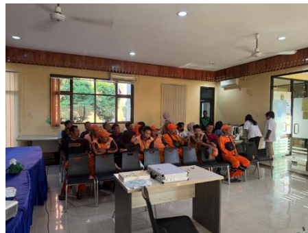
Gambar 5. Pertemuan dengan Petugas PPSU.

Pemeriksaan kesehatan mata pada peserta dilakukan secara langsung di lokasi kegiatan menggunakan instrumen sederhana yang meliputi penlight, lup (kaca pembesar), Snellen chart, dan trial lens. Pemeriksaan dilakukan secara monokular untuk masing-masing mata guna mengidentifikasi adanya kelainan pada segmen anterior, khususnya pteregium sebagai pertumbuhan jaringan fibrovaskular pada konjungtiva, serta katarak yang ditandai dengan kekeruhan lensa. Selain itu, pengukuran tajam penglihatan dilakukan menggunakan Snellen chart untuk menilai fungsi visual dasar peserta. Pendekatan pemeriksaan ini bersifat skrining awal, yang tidak hanya bertujuan untuk mendeteksi kelainan secara sederhana, tetapi juga sebagai sarana edukatif untuk meningkatkan kesadaran peserta terhadap kondisi kesehatan mata mereka.