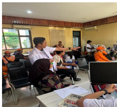
Gambar 2. Pengarahan dan Pemeriksaan Mata.

Oleh karena itu, implikasi dari kegiatan ini tidak hanya berhenti pada tingkat individu, tetapi juga mengarah pada kebutuhan intervensi yang lebih sistemik. Program edukasi perlu diintegrasikan dengan kebijakan kesehatan kerja, termasuk penyediaan alat pelindung mata dan penguatan regulasi keselamatan kerja bagi pekerja sektor informal (Scales and Gorman, 2022; Alyafei and Easton-Carr, 2024). Dalam konteks yang lebih luas, kegiatan ini menunjukkan bahwa pendekatan berbasis komunitas dapat menjadi pintu masuk yang efektif dalam membangun kesadaran kesehatan dan mendorong transformasi sosial secara bertahap.