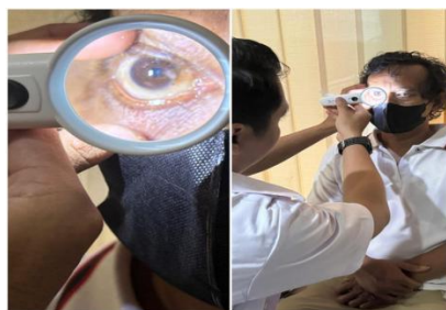
Gambar 3. Pemeriksaan Mata PPSU Kelurahan Pengadegan.