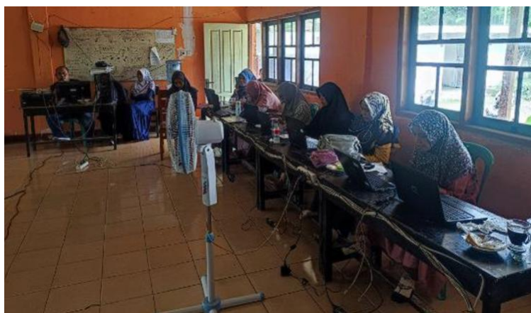
Gambar 6. Foto Guru Mempraktikkan Pembuatan Media Pembelajaran Digital.

Secara keseluruhan, ketiga foto tersebut memberikan bukti kualitatif yang kuat bahwa kegiatan pengabdian masyarakat ini tidak hanya meningkatkan kompetensi guru secara teknis, tetapi juga membangun suasana belajar yang kolaboratif, interaktif, dan berorientasi pada praktik. Integrasi antara hasil kuantitatif (pretest–posttest), hasil kualitatif (foto dan observasi), serta teori pendukung menunjukkan bahwa kegiatan ini berhasil mencapai tujuannya dan memberikan kontribusi nyata terhadap transformasi digital sekolah. Temuan ini juga mendukung penelitian Sari dan Yusuf (2023) serta Wahyuni dan Arifin (2021), yang menegaskan bahwa penguatan literasi digital dan branding sekolah merupakan fondasi penting dalam meningkatkan citra lembaga pendidikan di era digital. Dengan demikian, pelatihan ini dapat menjadi model yang dapat direplikasi di sekolah lain yang menghadapi tantangan serupa dalam meningkatkan literasi digital dan penguatan branding sekolah.