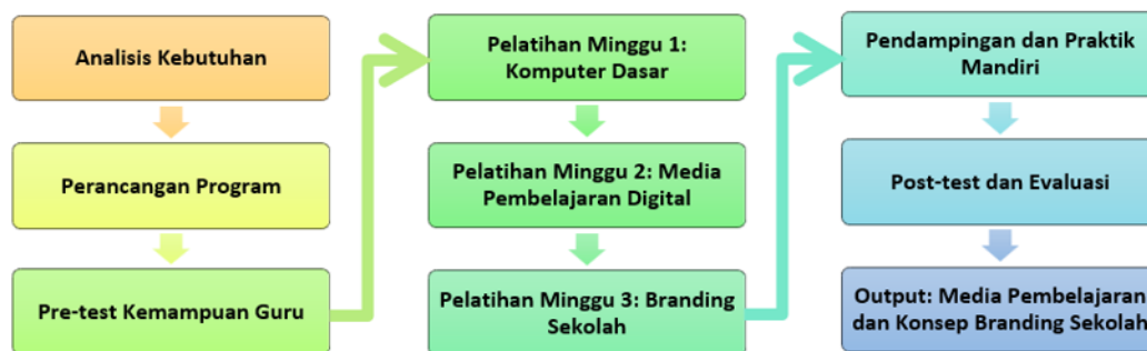
Gambar 1. Tahapan Kegiatan Pelatihan.

Evaluasi dilakukan melalui posttest untuk mengukur peningkatan kompetensi peserta. Penggunaan pretest–posttest merupakan metode evaluasi yang umum digunakan dalam penelitian pendidikan (Rahmawati & Sudirman, 2022). Hasil tes kemudian divisualisasikan dalam bentuk tabel, diagram batang, dan grafik persentase untuk memudahkan analisis. Selain data kuantitatif, observasi langsung juga dilakukan untuk melihat tingkat partisipasi, kemampuan praktik, serta kendala yang dihadapi guru selama pelatihan. Pendekatan kombinasi ini memberikan gambaran yang lebih komprehensif mengenai dampak pelatihan.