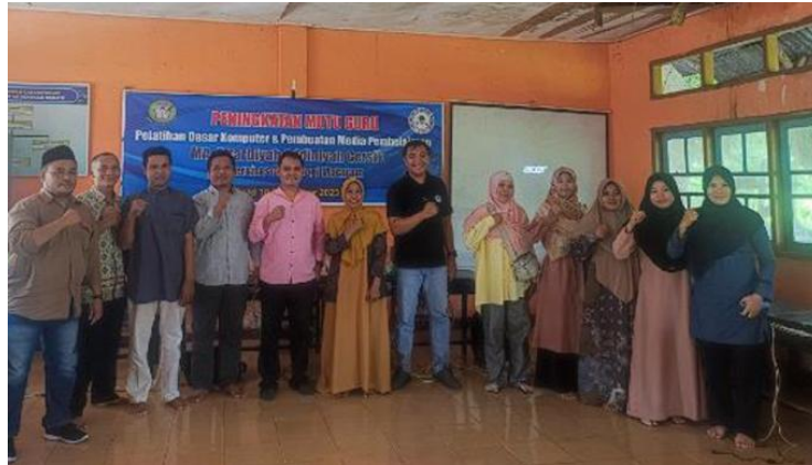
Gambar 5. Foto Pelatihan Media Pembelajaran di Ruang Kelas.

Foto ketiga memperlihatkan suasana pelatihan yang paling representatif dari proses pembelajaran berbasis praktik. Dalam foto ini, guru-guru tampak duduk di meja panjang, masing-masing bekerja menggunakan laptop mereka. Instruktur terlihat memberikan pendampingan langsung, sementara guru mempraktikkan materi pelatihan secara mandiri. Foto ini memberikan bukti visual bahwa pelatihan benar-benar berbasis praktik ( hands-on training ), bukan hanya ceramah atau demonstrasi. Suasana kelas yang aktif, dengan guru yang fokus pada layar laptop masing-masing, menunjukkan bahwa mereka terlibat secara penuh dalam proses pembelajaran. Dokumentasi ini memperkuat hasil posttest yang menunjukkan peningkatan terbesar pada aspek pembuatan media pembelajaran digital.