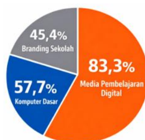
Gambar 3. Grafik Persentase Peningkatan.

Grafik persentase memperlihatkan bahwa peningkatan kompetensi guru mencapai lebih dari 45% pada seluruh aspek, dengan peningkatan tertinggi pada media pembelajaran digital. Hal ini menunjukkan bahwa pelatihan memberikan dampak yang kuat terhadap kemampuan guru dalam memanfaatkan teknologi untuk pembelajaran.