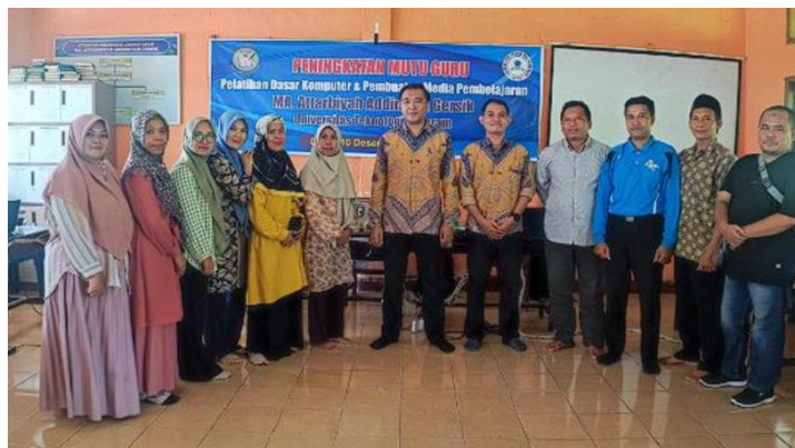
Gambar 4. Foto Peserta Pelatihan Dasar Komputer dan Media Pembelajaran.

Foto kedua memperlihatkan suasana pelatihan di ruang kelas, di mana guru-guru tampak berdiri bersama instruktur di depan banner pelatihan dari sekolah lain yang juga menjadi lokasi kegiatan. Foto ini menunjukkan bahwa pelatihan tidak hanya dilakukan di satu lokasi, tetapi juga melibatkan beberapa lembaga pendidikan yang memiliki kebutuhan serupa. Hal ini menunjukkan bahwa model pelatihan yang dikembangkan bersifat adaptif dan dapat diterapkan di berbagai konteks sekolah. Keterlibatan guru dari berbagai latar belakang memperkuat temuan Setiawan & Lestari (2022) bahwa literasi digital berkembang lebih cepat ketika peserta berasal dari lingkungan yang beragam dan saling bertukar pengalaman. Selain itu, temuan ini juga mendukung penelitian Pratama & Setiawan (2021) yang menekankan pentingnya kolaborasi lintas sekolah dalam penguatan branding dan transformasi digital.