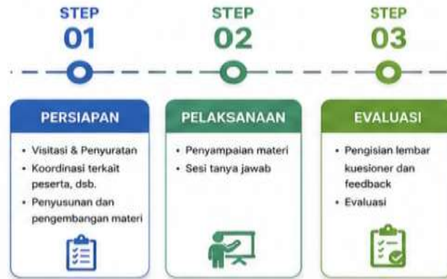
Gambar 1. Diagram Alur Metode Pelaksanaan

Pelaksanaan sosialisasi ini disusun melalui 3 tahapan, yang pertama yaitu tahapan persiapan, pelaksanaan dan evaluasi. Pada tahapan persiapan, dilakukan kunjungan lokasi untuk pemetaan teknis lapangan untuk mempersiapkan sarana dan prasarana serta audiens yang dibutuhkan untuk pelaksanaan program dan koordinasi dengan pihak perangkat Desa Waisarisa guna menginformasikan mengenai kegiatan sosialisasi yang akan dilakukan. Pada tahap ini juga penyusunan materi dilakukan dengan menyesuaikan kebutuhan dan pemahaman masyarakat di lokasi. Selain itu koordinasi juga dilakukan dengan pihak Universitas Pattimura, perangkat Desa Waisarisa, dan pihak berwenang di Desa Waisarisa untuk kelancaran program ini. Pada tahap persiapan ini disiapkan dengan baik untuk efektifitas jalannya program, agar alur kegiatan berjalan dengan terstruktur dan efisien.