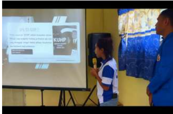
Gambar 4. Dokumentasi Kegiatan Sosialisasi KUHP dan KUHP Nasional.