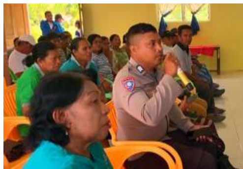
Gambar 4. Dokumentasi Kegiatan Sosialisasi KUHP dan KUHP Nasional.