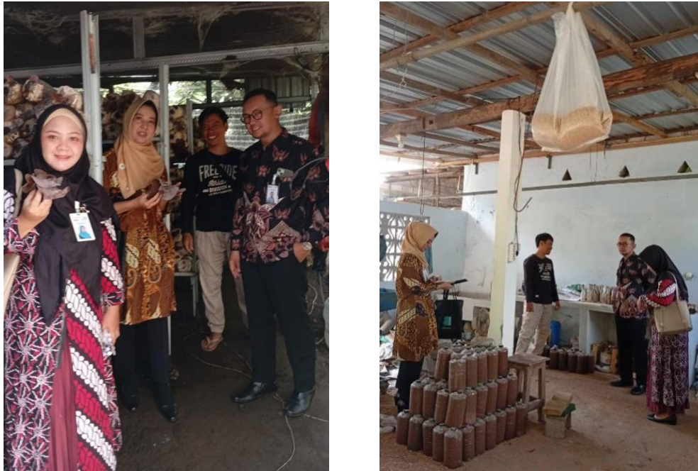
Gambar 2. Proses Identifikasi Awal Usaha Brother Farm.

lokasi usaha, kapasitas produksi, kondisi permodalan, sistem penjualan, serta target pasar yang dituju (Purboyo et al., 2022). Selain observasi lapangan, dilakukan pula wawancara mendalam dengan pemilik usaha guna menggali informasi terkait proses produksi mulai dari budidaya hingga pengolahan jamur kuping kering, kendala yang dihadapi dalam menjalankan usaha, serta rencana pengembangan usaha ke depan.