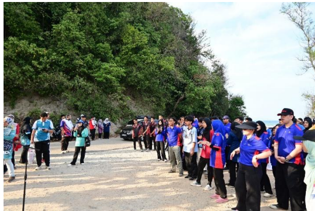
Gambar 2. Pelaksanaan PkM Kolaborasi Internasional di Bukit Keluang

Kegiatan pengabdian ini telah dilakukan sesuai tahapan yang telah dikemukakan sebelumnya, berikut disajikan dokumentasi pada saat kegiatan pengabdian dilaksanakan.