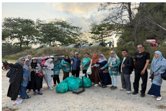
Gambar 5. Kegiatan Bersih Pantai di Bukit Keluang