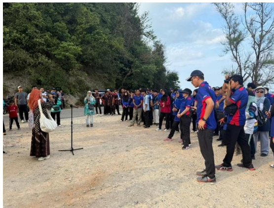
Gambar 4. Edukasi Kesantunan Berbahasa Terkait Pengurangan Sampah