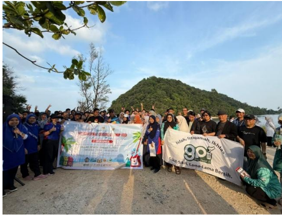
Gambar 3. Foto bersama Tim PkM dan Mitra