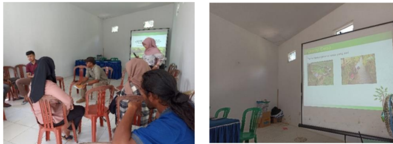
Gambar 4. Pelaksanaan FGD

dinilai baik secara gambar, video, dan editing akan mendapatkan hadiah dari TIM Pengabdian UNNES. Adapun dokumentasi dari kegiatan tersebut: