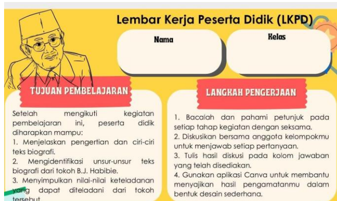
Gambar 1. Tampilan Sampul Lembar Kerja Peserta Didik (LKPD).

Aspek visual bahan ajar dirancang menggunakan platform Canva dengan memperhatikan prinsip keterbacaan, konsistensi desain, keseimbangan tata letak, dan kesesuaian ilustrasi. Desain visual yang menarik diharapkan mampu meningkatkan motivasi belajar sekaligus mempermudah peserta didik dalam memahami materi yang dipelajari.