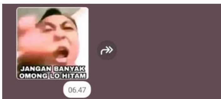
Gambar 4. Stiker WhatsApp 4.

Pasal 28 ayat (2) mengatur tentang larangan melakukan ujaran kebencian terhadap suku, agama, dan ras (SARA).