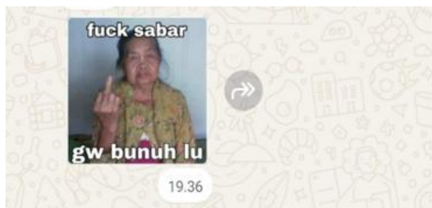
Gambar 7. Stiker WhatsApp 7.

Pasal 29 mengatur mengenai larangan ancaman atau menakut-nakuti secara pribadi.