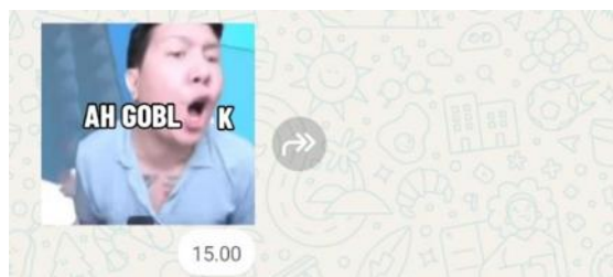
Gambar 3. Stiker WhatsApp 3.

Data di atas menunjukkan penggunaan stiker WhatsApp dengan gambar seorang pria yang tengah berteriak sehingga mulutnya membentuk huruf “o”. Huruf tersebut berfungsi untuk melengkapi kata “gobl...k” sehingga membentuk tuturan “ah goblok”.