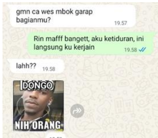
Gambar 1. Stiker WhatsApp 1.

Pasal 27A mengatur tentang tindak pidana pencemaran nama baik atau penyerangan kehormatan seseorang melalui media elektronik.