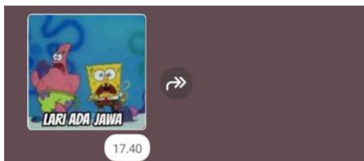
Gambar 6. Stiker WhatsApp 6.

Penggunaan stiker ini berpotensi melanggar UU Nomor 1 Tahun 2024 Pasal 28 ayat (2) apabila penggunaannya dilakukan dalam konteks yang dapat menimbulkan kebencian terhadap etnis Tionghoa. Dalam dunia digital, penggunaan identitas etnis sebagai objek candaan dapat menimbulkan interpretasi yang berbeda-beda dari setiap individu.