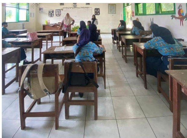
Gambar 1. Kegiatan Pembelajaran Berdiferensiasi.

Media pembelajaran yang direncanakan meliputi PowerPoint, lembar observasi, dan LKPD. PowerPoint digunakan untuk menyajikan konsep dan contoh teks secara visual. Lembar observasi digunakan untuk membantu siswa mencatat hasil pengamatan terhadap objek nyata. LKPD disusun sebagai panduan siswa dalam menyusun teks deskripsi secara bertahap, mulai dari menentukan objek, mencatat detail, menyusun kerangka, mengembangkan paragraf, hingga merefleksikan hasil tulisan. Dalam LKPD, diferensiasi terlihat dari tingkat bantuan yang berbeda. Siswa yang memerlukan bantuan diberi kerangka lebih terstruktur, sedangkan siswa yang lebih mandiri diberi ruang lebih bebas untuk mengembangkan tulisan.