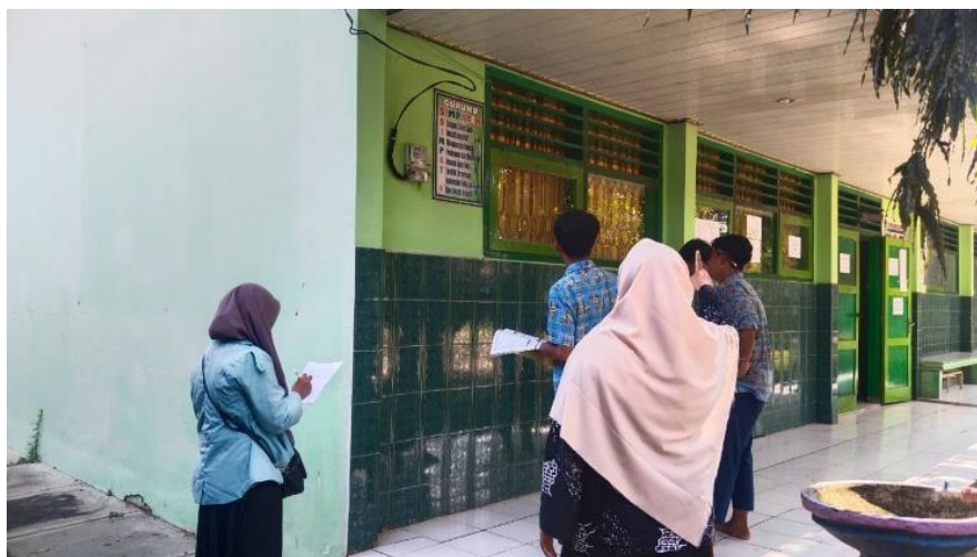
Gambar 3. Pembelajaran Berdiferensiasi di Luar Kelas.

Pelaksanaan pembelajaran menunjukkan bahwa diferensiasi proses dan lingkungan belajar berperan penting dalam membantu siswa menulis teks deskripsi. Kegiatan pengamatan langsung terhadap objek nyata menjadi strategi yang paling menonjol (Rahmawati et al., 2023). Pengamatan memungkinkan siswa memperoleh detail konkret yang dapat dijadikan bahan tulisan. Hal ini menjawab salah satu masalah utama siswa, yaitu kesulitan menemukan ide. Ketika siswa melihat, mendengar, menyentuh, atau merasakan suasana objek secara langsung, mereka memiliki lebih banyak informasi untuk dikembangkan menjadi paragraf deskriptif.