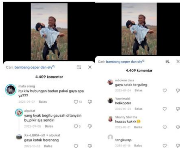
Gambar 2. Tangkapan Layer video Kolom komentar TikTok Akun @elymanis.