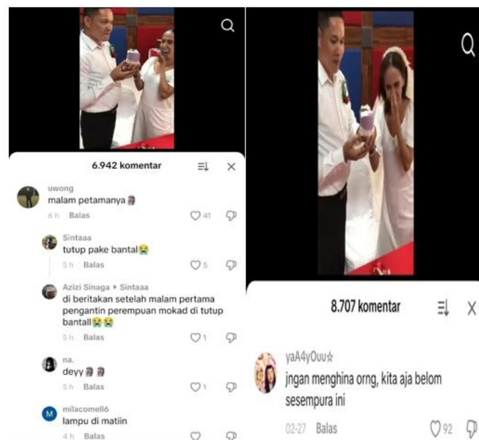
Gambar 3. Tangkapan Layer Video Kolom Komentar TikTok Akun @Fred Diaz .

sesempurna ini” sebagai kehadiran tutur lawan bahwa komentar sebelumnya tidak dapat dipersepsikan sebagai lelucon kalimat “jangan menghina” mengisyaratkan bahwa beberapa komentar tersebut masuk dalam aspek penghinaan serta kata “jangan” menandakan adanya ketidaksetujuan dengan memberikan saran pada warganet untuk berhenti melakukan Cyberbullying penghinaan yang dibalut dengan lelucon. Hal ini, sejalan dengan penelitian Afrida wati et. al. (2025) yang menunjukkan adanya bullying verbal dalam kolom komentar TikTok dari beragam bentuk, ejekan, dan kritik berlebihan, serta sindiran halus dengan konteks pribadi korban, sehingga menimbulkan dampak psikologis dan rendahnya rasa percaya diri. Cyberbullying sexual harassment biasanya terjadi dengan mengkontruksi tubuh perempuan sebagai bahan objek vidusl yang bebas untuk dikomentari, bentuk dengan logika patriarkis yang berasal dari dalam budaya digital Hasnah (2015) dalam Firsatara Shalihat et al (2025). Pada konteks kasus ini korban dapat merasa insecure dengan fisik yang dimiliki dan ketidaknyaman dalam bermedia sosial disebabkan komentar-komentar yang negatif terhadap kekurangan fisik yang dimilikinya.