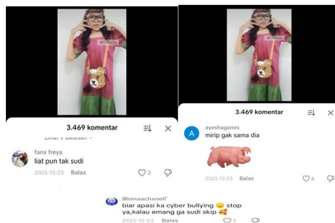
Gambar 2. Tangkapan Layer video Kolom komentar TikTok Akun @itakarya.