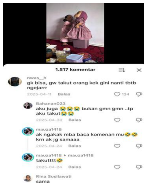
Gambar 6. Tangkapan Layer Video Kolom Komentar TikTok Akun @elymanis.