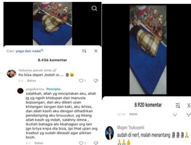
Gambar 4. Tangkapan Layer Video Kolom Komentar TikTok Akun @yoga&anna.