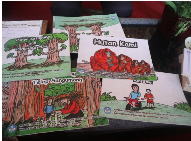
Gambar 2. Dokumentasi ketersediaan buku cerita rakyat Kalimantan Tengah di Perpustakaan SDN Tuwung-1

Selain data tabelaris, penelitian ini juga menemukan beberapa temuan kualitatif terkait ketersediaan buku. Pertama, kondisi fisik sebagian besar buku masih layak baca, tetapi ditemukan kerusakan minor pada beberapa judul di SDN Bukit Rawi 1. Kedua, buku-buku tersebut tidak sepenuhnya terintegrasi dalam katalog perpustakaan, sehingga akses siswa tidak merata dan peminjaman jarang dilakukan secara sistematis. Ketiga, tingkat kompleksitas bahasa dalam beberapa judul buku di SDN Bukit Rawi 1 belum sepenuhnya sesuai dengan kemampuan membaca siswa kelas rendah.