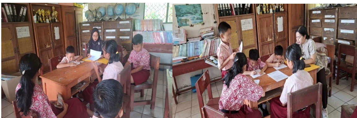
Gambar 3. Dokumentasi Pemanfaatan Cerita Rakyat dalam Kegiatan Diskusi Pembelajaran di Kelas

Hasil penelitian menunjukkan bahwa pemanfaatan buku cerita rakyat Kalimantan Tengah dalam pembelajaran masih bersifat insidental dan belum menjadi prioritas dalam pembelajaran rutin.