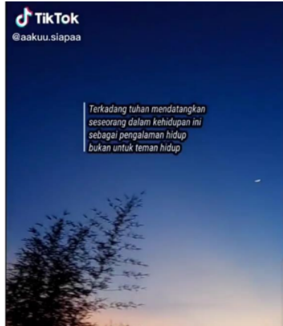
Gambar 2. Kesalahan penggunaan huruf kapital

Dalam postingan ini yang diunggah oleh akun @aaku.siapaa, kesalahan penggunaan huruf kapital terlihat pada tulisan “tuhan” yang seharusnya menggunakan huruf kapital sebagai huruf pertama yakni “Tuhan” hal ini berkaitan dengan nama agama, kitab suci dan juga subjek, yang selalu menggunakan huruf kapital sebagai huruf pertama.